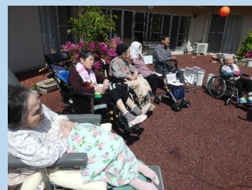
5月22日 中庭でリフレッシュ