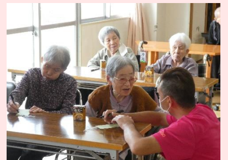
7月1日七夕飾りつけ