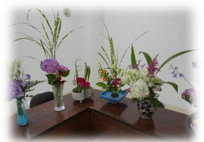
浄圓寺仏婦様 (6月19日)