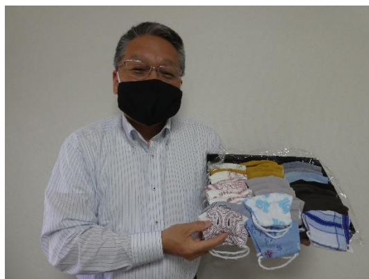
5月21日 家族からのマスク寄贈