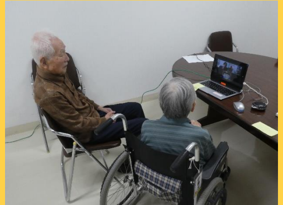
6月 オンライン面会 (zoom)